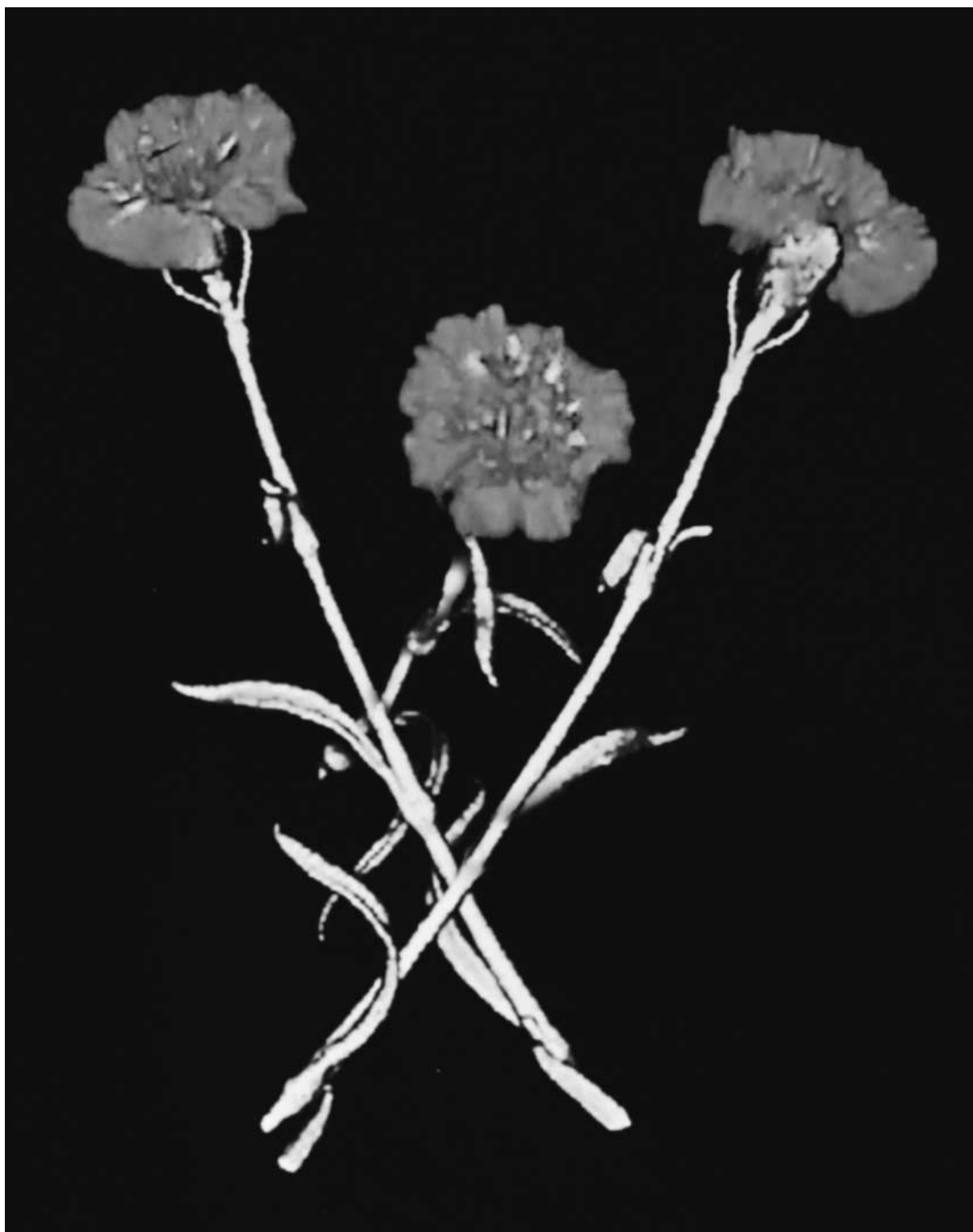
Компьютерная томограмма гвоздики.

3D-реконструкция с цветовым картированием. В “букете” представлена одна и та же гвоздика в различных проекциях трехмерного изображения.